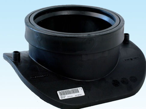
Переходной седловой отвод типа Top-Loading для канализации