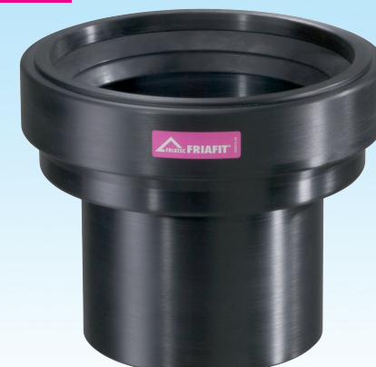
Переходной элемент ПЭ - керамика

Более детальную информацию Вы можете найти в Internet на нашем сайте по адресу www.friafit.com .