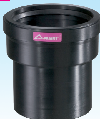
Переходной элемент ПЭ - ПВХ/ПП