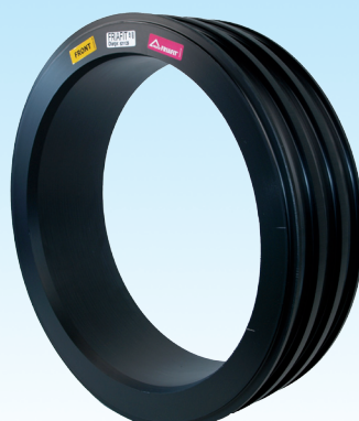
Канализационная шахтная футеровка