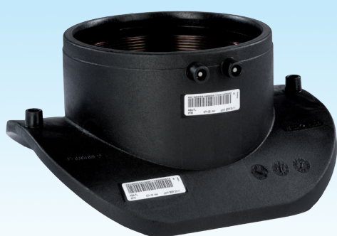
Седловой отвод типа Top-Loading для канализации