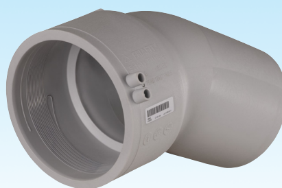
Канализационный отвод (муфта/спигот) 15°, 30°, 45°