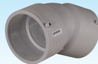
Канализационный отвод (муфта/муфта) 15°, 30°, 45°