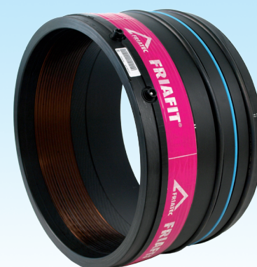
Канализационная вставная муфта