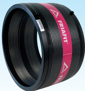
Муфта соединительная SDR 17